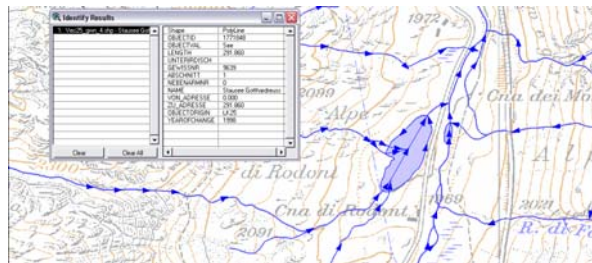
Même situation dans VECTOR25: Le lac apparaît sur la CN25 et contient des attributs OFEG.

L'ajustement de la géométrie des lacs de la couche <gwn> avec les surfaces de lacs de la couche <pri> a été amélioré de manière générale.